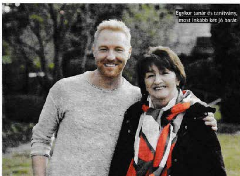
Egykor tanár és tanítvány, most inkább két jó barát

– Egy egészen más, számomra merőben új világba kerültem. Éppen musicalt, a már legendás Fame-et próbálták, ennek a kellős közepébe csöppentem bele, egy nagyon friss,